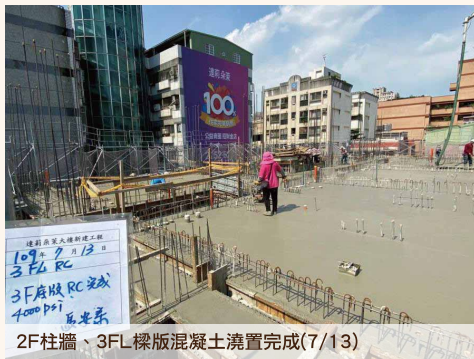
2F柱牆、3FL樑版混凝土澆置完成(7/13)