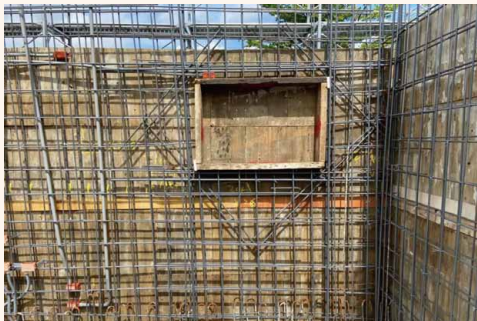
2FL柱牆鋼筋綁紮，開口部分鋼筋補強