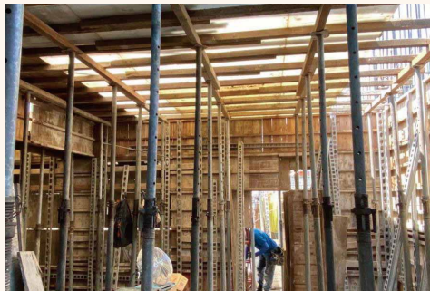
3FL樑版模板支撐架施作