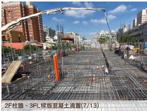
2F柱牆、3FL樑版混凝土澆置(7/13)