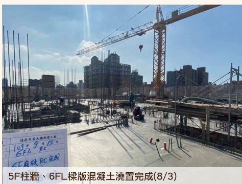
5F柱牆、6FL 樑版混凝土澆置完成(8/3)