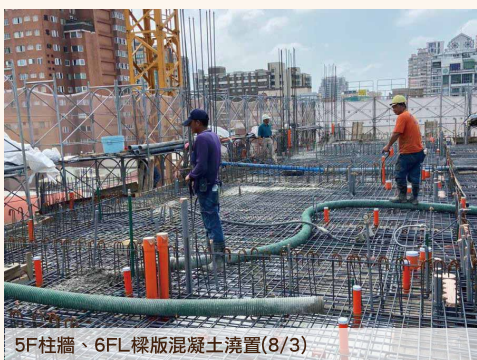
5F柱牆、6FL 樑版混凝土澆置(8/3)