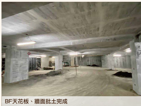
BF天花板、牆面批土完成

上層結構體持續施作外， 地下室也同步進行裝修工程， 施作內牆打底粉光及天花板批土。