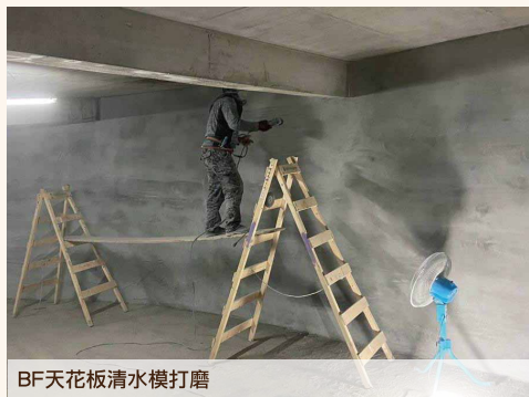
BF天花板清水模打磨