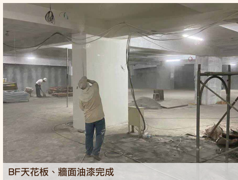
BF天花板、牆面油漆完成