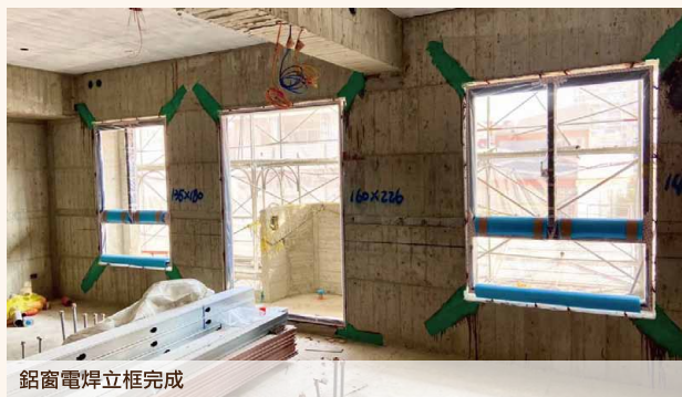
鋁窗電焊立框完成