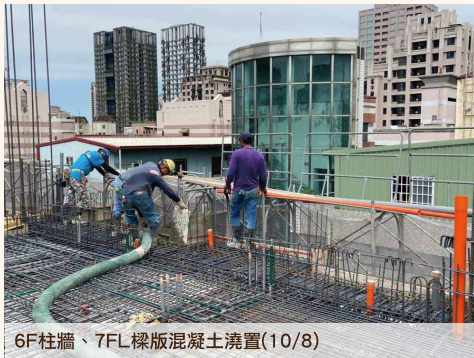
6F柱牆、7FL樑版混凝土澆置(10/8)