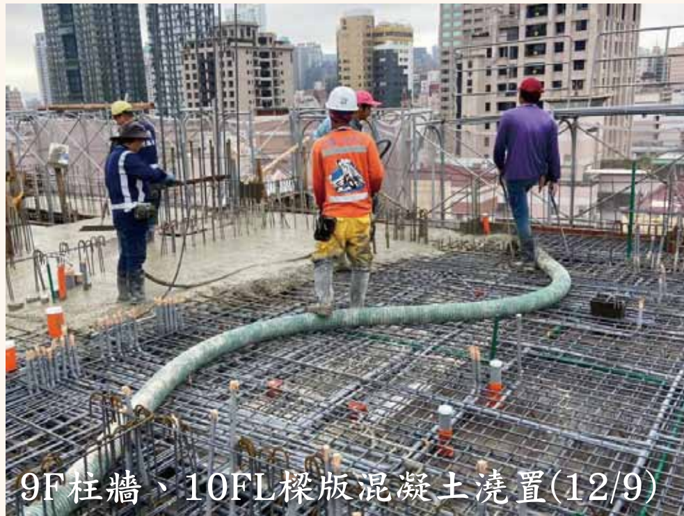
9F柱牆、10FL樑版混凝土澆置(12/9)