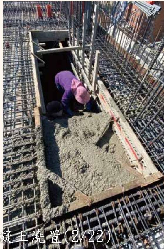
1R2F柱牆、R3FL樑版混凝土澆置(2/22)