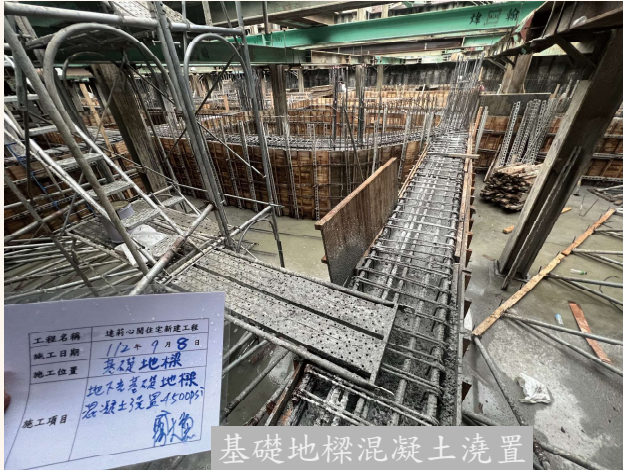
基礎地樑混凝土澆置